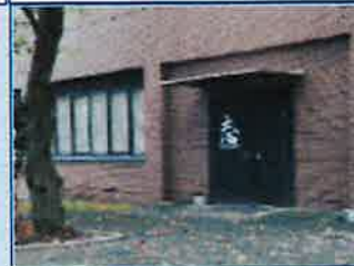
③右手「志」の文字が書いてあるドアが入口